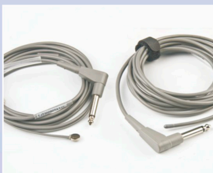
Skin or Rectal Probe Temp.