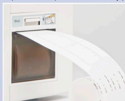
Thermal Array Printer & Recorder (Included)