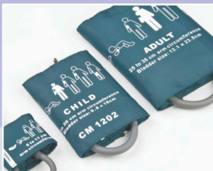
NiBP Cuff (Dewasa-Anak-Bayi)