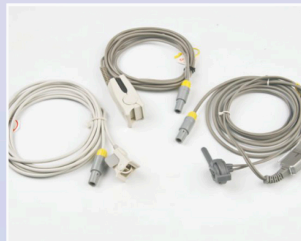
Spo2 Sensor (Dewasa-Anak-Bayi)