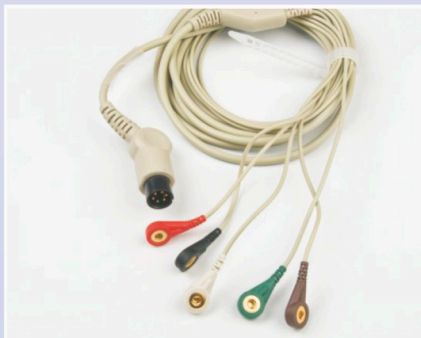
ECG Patient Cable