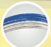
water and air tubing