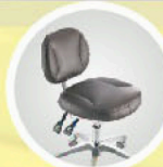
Ergonomically designed six way deluxe dentist stool, providing robust support for hip and waist, adopting imported silent wheel