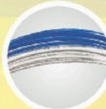
water and air tubing