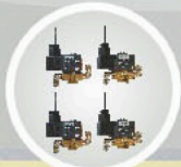
Parker solenoid valve