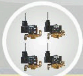
Parker solenoid valve