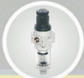
air filter regulator