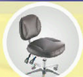
Ergonomically designed six way deluxe dentist stool, providing robust support for hip and waist, adopting imported silent wheel