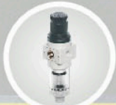
air filter regulator